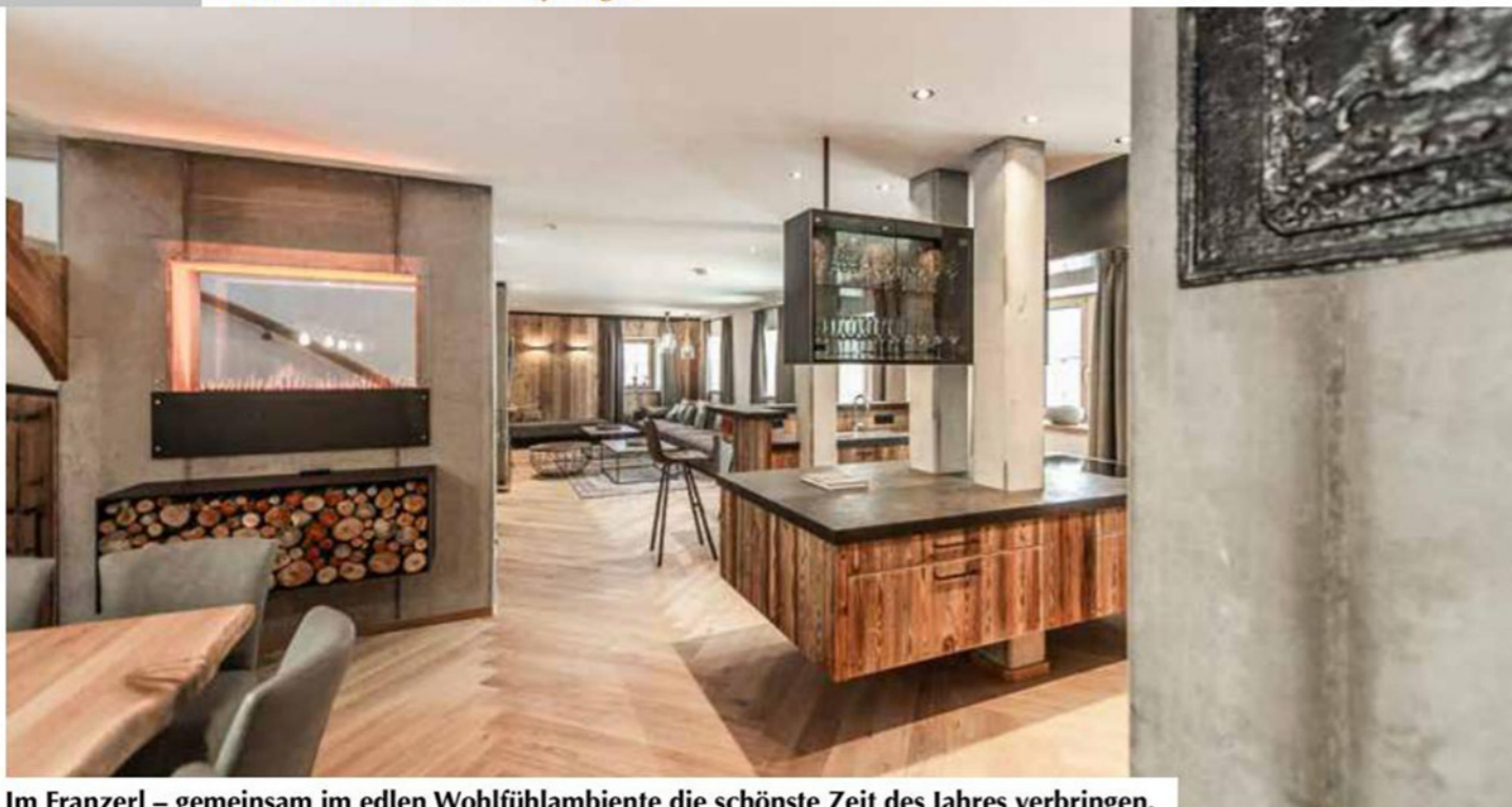
Im Franzerl – gemeinsam im edlen Wohlfühlambiente die schönste Zeit des Jahres verbringen.